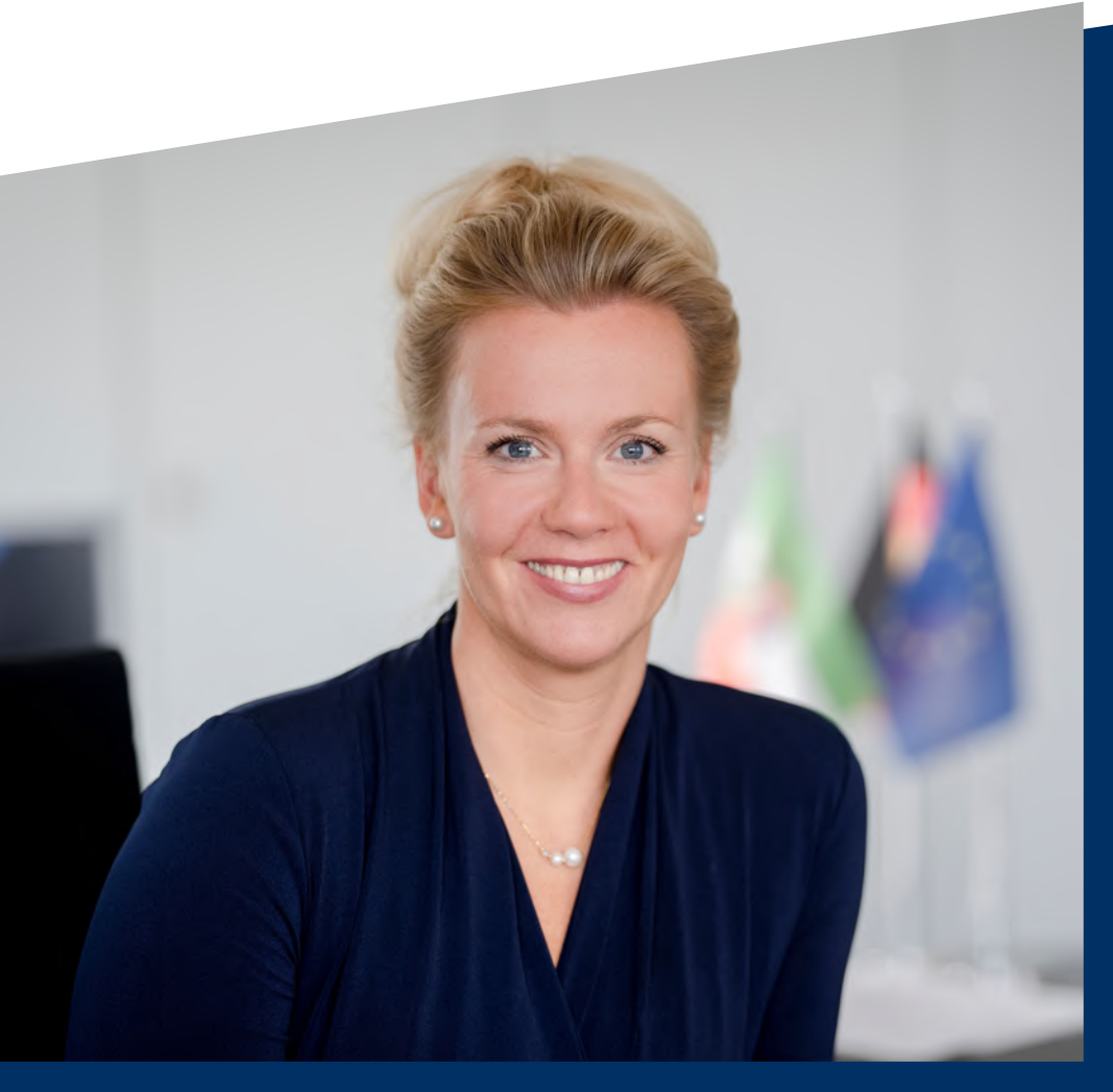
Ina Brandes Ministerin für Kultur und Wissenschaft NRW

mit dem Kulturförderbericht möchten wir Ihnen einen Einblick in die zahlreichen Initiativen und Projekte geben, die das Ministerium für Kultur und Wissenschaft im Jahr 2023 gefördert und umgesetzt hat und die unsere reiche Kulturlandschaft in Nordrhein-Westfalen gezielt stärken und weiterentwickeln. Der Bericht umfasst detaillierte Informationen zu den folgenden Schwerpunktthemen der Landeskulturförderung: