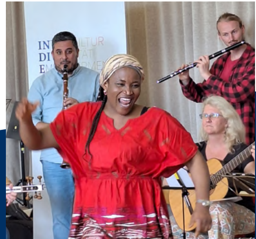
Zertifikatslehrgang Musikpädagogik für Zugewanderte Landesmusikakademie NRW

Landesmusikakademie NRW Zertifikatslehrgang Musikpädagogik für Zugewanderte