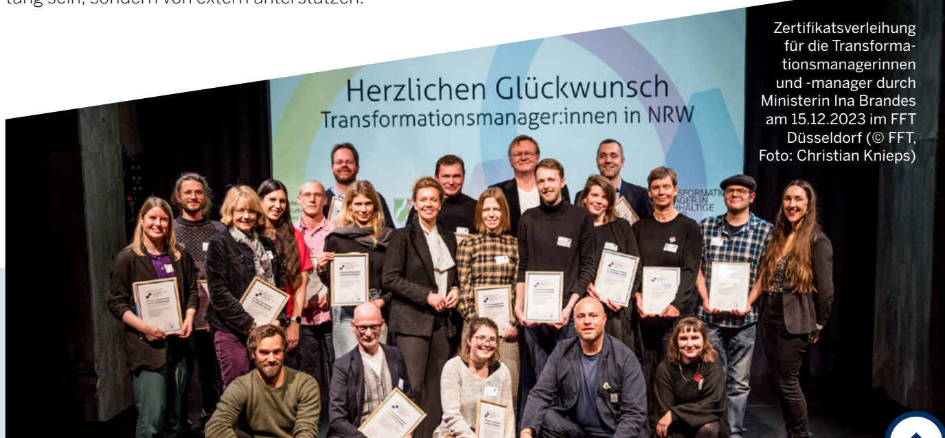
Zertifikatsverleihung für die Transformationsmanagerinnen und -manager durch Ministerin Ina Brandes am 15.12.2023 im FFT Düsseldorf

Im vierten Handlungsfeld geht es um die fachliche Beratung und den Austausch der Kulturschaffenden untereinander. Hier steht die gemeinsam mit den Landschaftsverbänden erstellte Plattform im Mittelpunkt, auf der Best-Practice-Beispiele etwa zum Thema Mobilität ebenso gespeichert werden können wie aktuelle Entwicklungen und Fördermöglichkeiten.