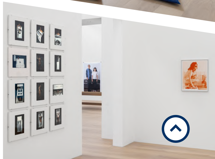
Ausstellungsansicht Kochen Putzen Sorgen. Care-Arbeit in der Kunst seit 1960 / Foto: Philipp Ottendörfer, © Josef Albers Museum Quadrat Bottrop