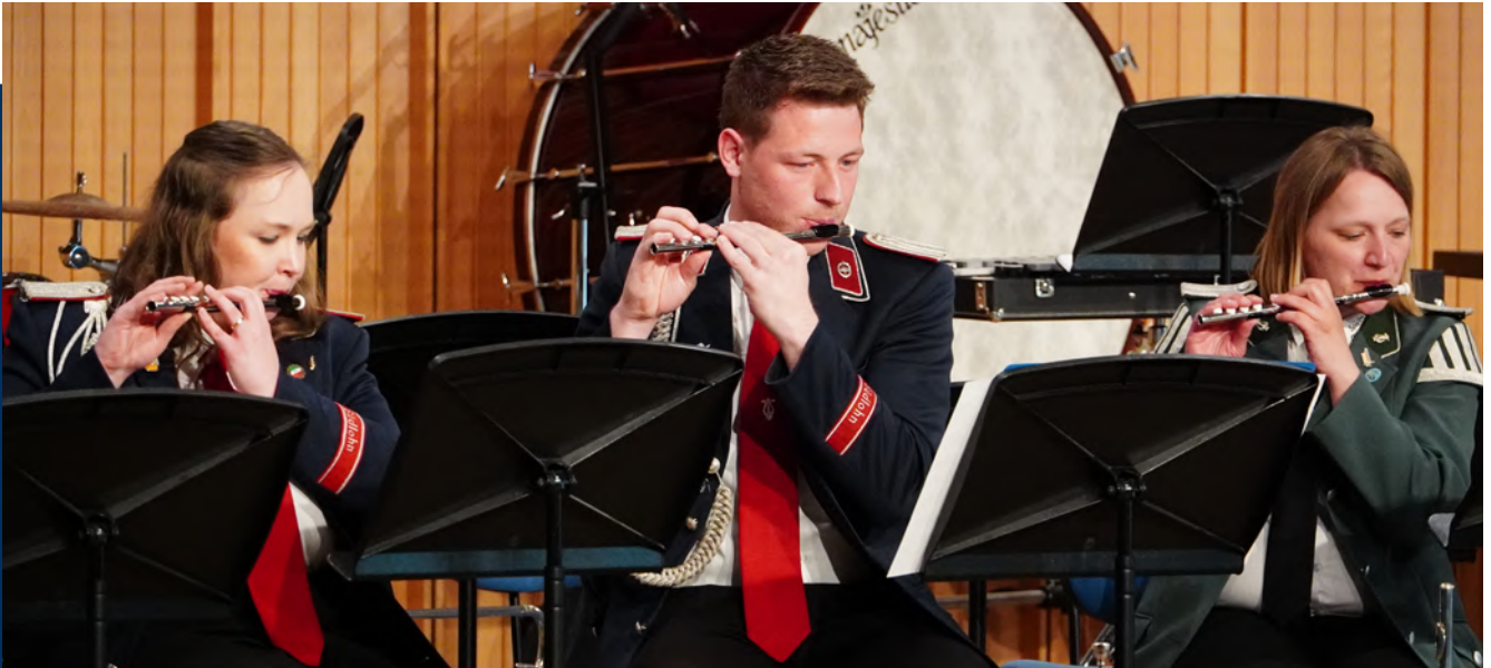
Abschlussveranstaltung C1/C2 Lehrgang Landesmusikakademie

Elf große Amateurmusikverbände im Land sind Mitglieder in der Arbeitsgemeinschaft Amateurmusik des Landesmusikrates. Sie erhalten jährlich eine Pauschale nach Mitgliederzahlen für ihre Bildungsarbeit, die sie auch an ihre Mitgliedervereine weiterleiten können. Die alltägliche Probenarbeit, die Kinder- und Jugendarbeit, Angebote zur musikalischen Bildung an Schulen und Kindergärten sowie Angebote zur Aus- und Weiterbildung werden mit dieser Pauschale unterstützt. Dadurch wird die langfristige Arbeit von Vereinen und Verbänden für Amateure vor Ort gestärkt. 50 Prozent der Ertragsmittel aus Glücksspielen finanzieren die Arbeit der Verbände.