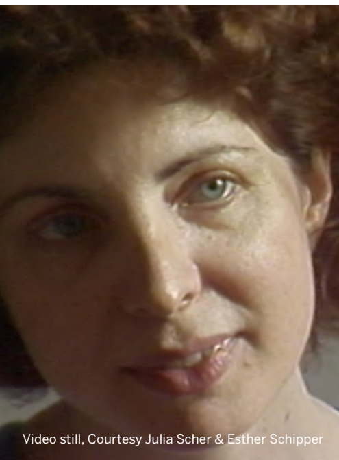
Video still, Courtesy Julia Scher & Esther Schipper