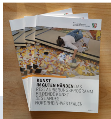
Publikation „Kunst in guten Händen“ 2023, anlässlich von 15 Jahren Restaurierungsprogramm

Die geförderten Projekte bilden die Vielfalt der Museen und ihrer Bestände ab. Häuser in allen Regionen und unterschiedlichster Größe konnten bereits von dem Programm profitieren. 2023 haben 17 Projekte eine Förderung erhalten, insgesamt wurden Mittel in Höhe von mehr als 430.000 Euro zur Verfügung gestellt.